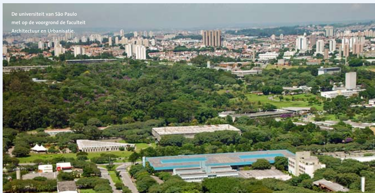
De universiteit van São Paulo met op de voorgrond de faculteit Architectuur en Urbanisatie.