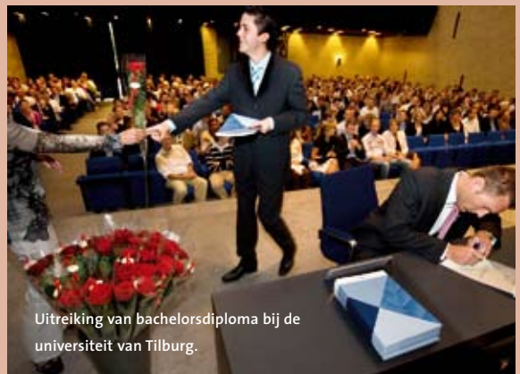
Uitreiking van bachelordiploma bij de universiteit van Tilburg.