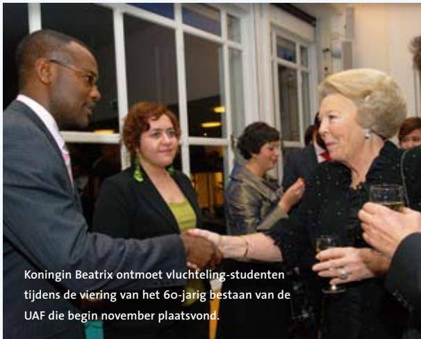
Koningin Beatrix ontmoet vluchteling-studenten tijdens de viering van het 60-jarig bestaan van de UAF die begin november plaatsvond.