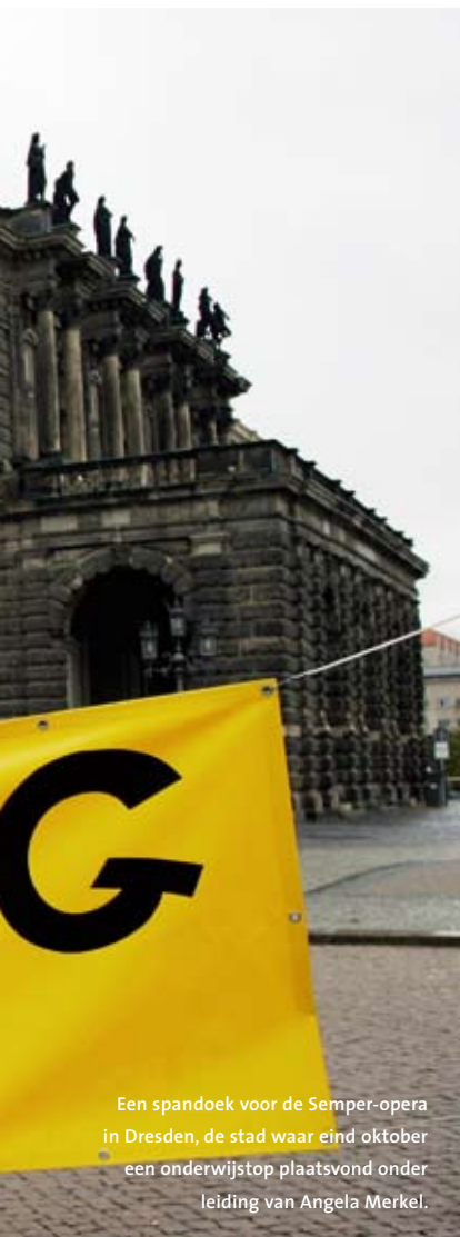
Een spandoek voor de Semper-opera in Dresden, de stad waar eind oktober een onderwijstop plaatsvond onder leiding van Angela Merkel.