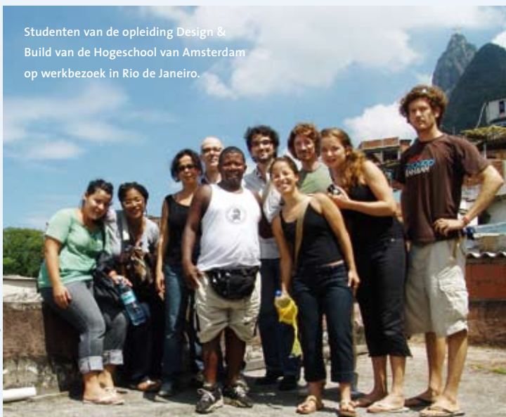
Studenten van de opleiding Design & Build van de Hogeschool van Amsterdam op werkbezoek in Rio de Janeiro.