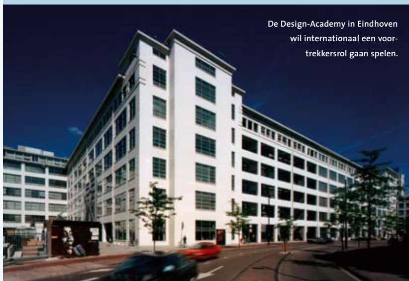
De Design-Academy in Eindhoven wil internationaal een voortrekkersrol gaan spelen.

Met het overige deel van het bedrag wordt verder geïnvesteerd in duurzaamheid. Aandacht voor de maatschappelijke rol van ontwerpers, met oog voor milieu en een duurzame samenleving, maakt de Design Academy volgens Plasterk internationaal toonaangevend. De minister wil de academie de kans geven die spilfunctie te versterken. De internationale reputatie van de hogeschool blijkt ook uit het predicaat 'School of Cool' dat Time Magazine de Eindhovenenaars in 2007 toekende. (AS)