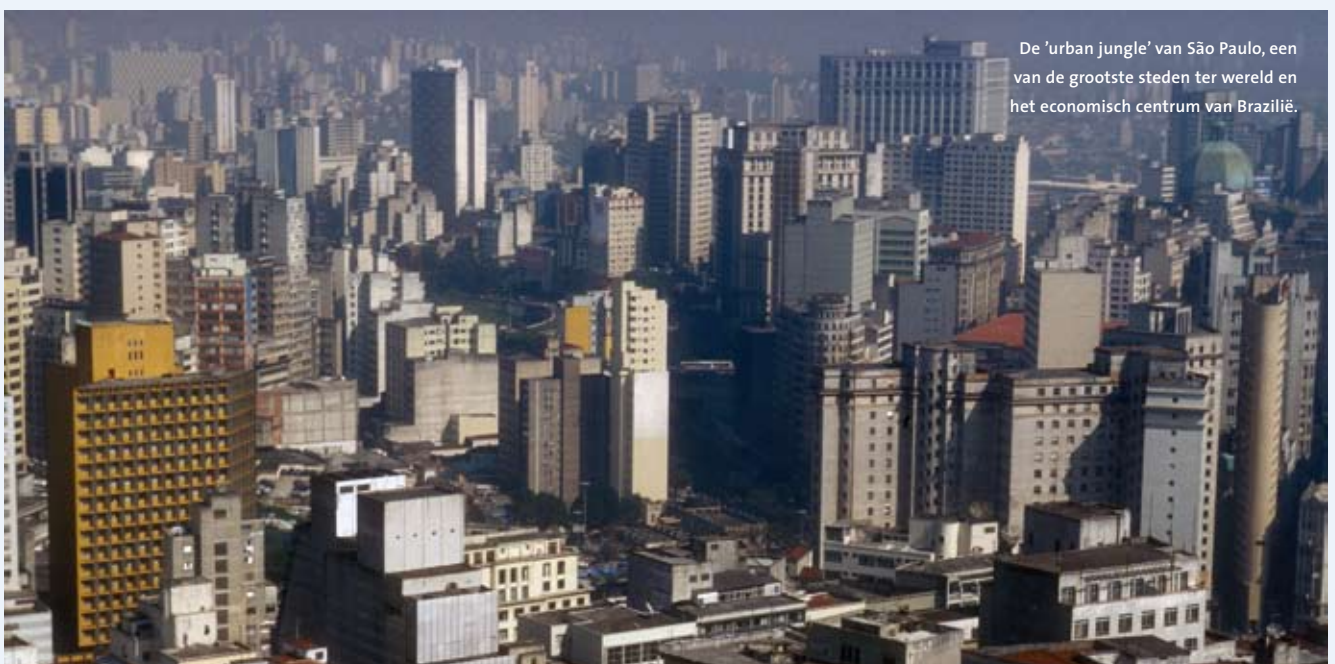
De 'urban jungle' van São Paulo, een van de grootste steden ter wereld en het economisch centrum van Brazilië.

Tegenwoordig zijn de handelsbetrekkingen tussen Nederland en Brazilië intensief en de belangen wederzijds. Brazilië staat in de toptien van wereld-economieën en na de Verenigde Staten is Nederland de grootste investeerder in het land. In 2007 was de invoer in Nederland van Braziliaanse producten goed voor 3,9 miljard euro, terwijl Nederland voor 1,2 miljard euro mocht exporteren. In april 2008 bracht de Braziliaanse president Lula een staatsbezoek aan Nederland. Behalve de nodige handelscontracten behoorde ook een overeenkomst voor samenwerking in het hoger onderwijs tot de wapenfeiten.