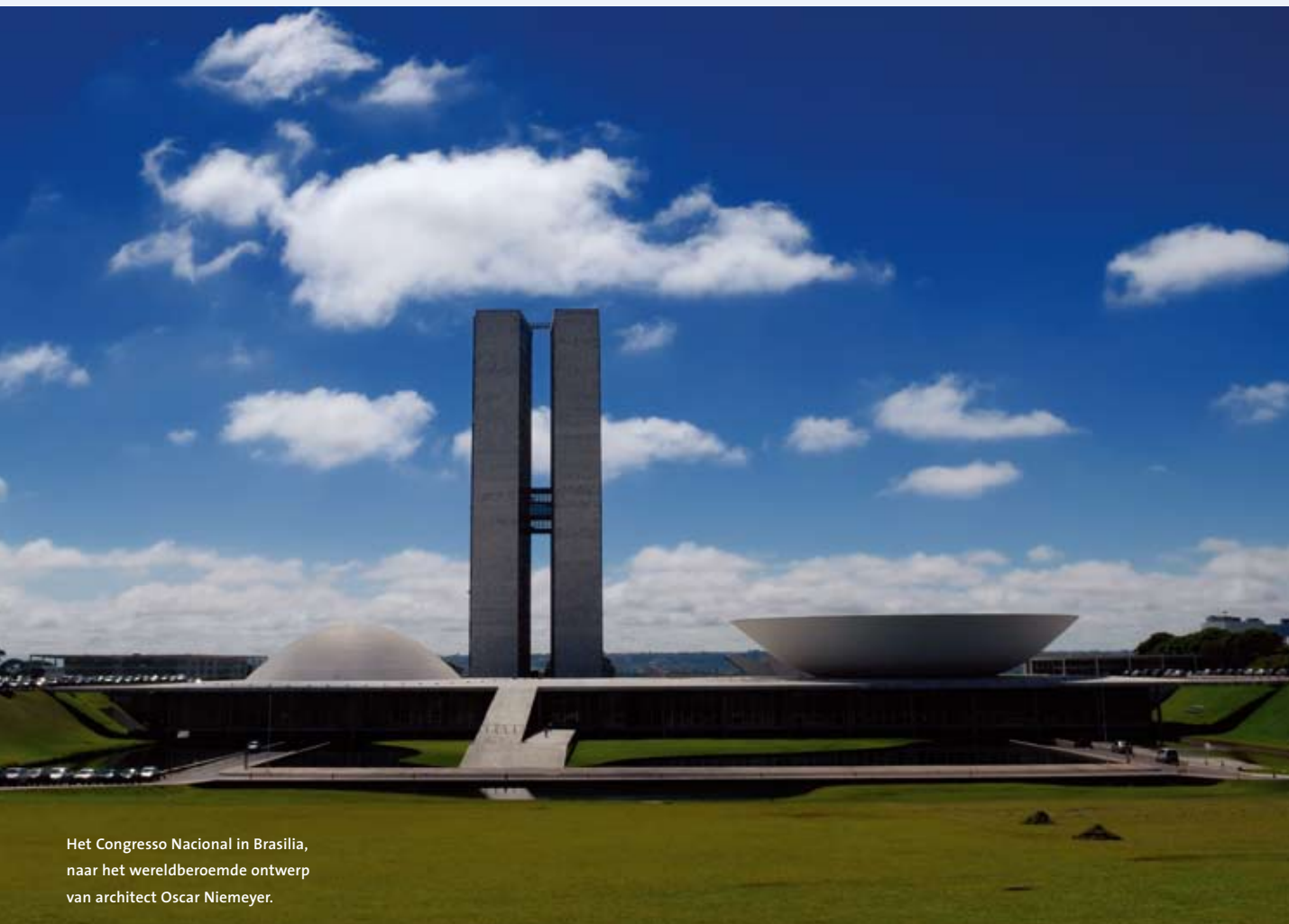
Het Congresso Nacional in Brasilia, naar het wereldberoemde ontwerp van architect Oscar Niemeyer.

lingen.” Volgens de oud-rector is de aantrekkingskracht van de VS onder Braziliaanse studenten bovenal een kwestie van faciliteiten. “Europa zou meer kunnen doen om buitenlands talent te lokken. De Amerikanen geven traditioneel veel meer beurzen dan Europa. Meer Engelstalig onderwijs zou ook helpen.”